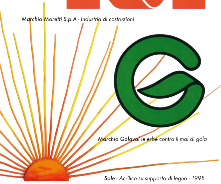
Marchio Golaval le erbe contro il mal di gola