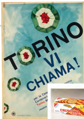
Manifesto per la celebrazione del 1°centenario dell'Unità d'Italia 1961

1969 Vince il Premio Nazionale indetto dal "Tempo" di Roma per l'alto livello artistico per le immagini pubblicitarie della GENERAL ELECTRIC. Mostra personale di pittura alla Galleria Triade di Torino.