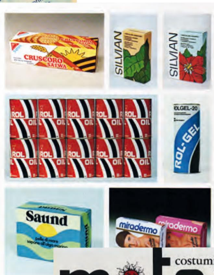
Packaging Cruscoro Rol Oil, Silvan linea per giardinaggio, Mira Lanza sapone