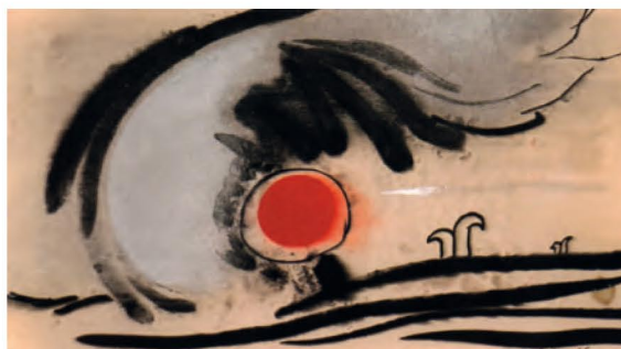
Senza titolo - Tempera, china su carta - 1968